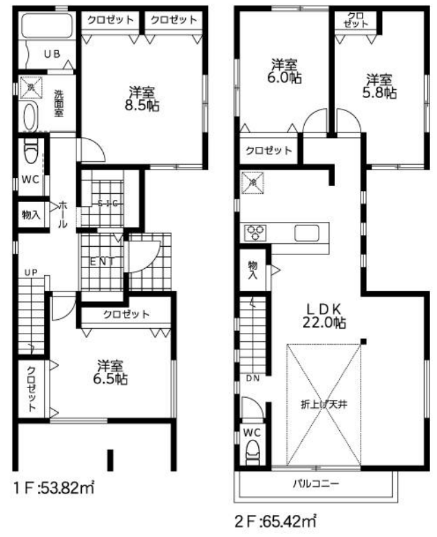
【参考プラン】建物面積:119.24㎡(36.07坪)